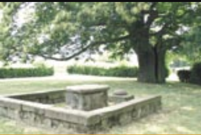
Das Freigericht in Kaichen

Eigentlich ist Niddatal auch nicht krimineller als die umliegenden Gemeinden. Dennoch hebt den Ort eine Besonderheit hervor: Er hatte zwei für das Umland bedeutende Gerichtsstätten. Direkt der Burg Friedberg unterstellt das Freigericht in Kaichen, ein Blutgericht, das über Leben und Tod der Delinquenten zu befinden hatte. In Assenheim war beim Grafen zu Solms-Rödelheim das Landgericht angesiedelt, das Recht nach der „Peinlichen Halsgerichtsordnung“